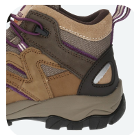
Planta (Suela) Bidensidad Anti-Fatigue