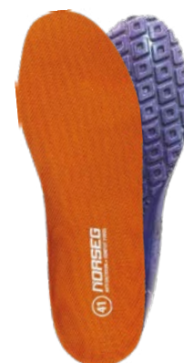
Plantilla comfort points & antibacterial mesh

ASTM ASTM INTERNATIONAL ASTM F2413-18 (EH)